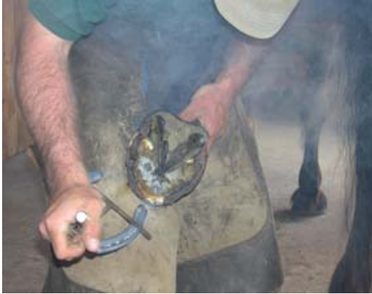
Ajustement à chaud

Selon Éric Chrétien « Cet article de maréchalerie n'apportera pas la réponse à tous les problèmes. Il